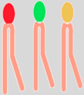
FOSFOLIPÍDIOS LONGOS E INSATURADOS