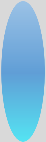
PROTEÍNA TRANSPORTADORA DE NUTRIENTES